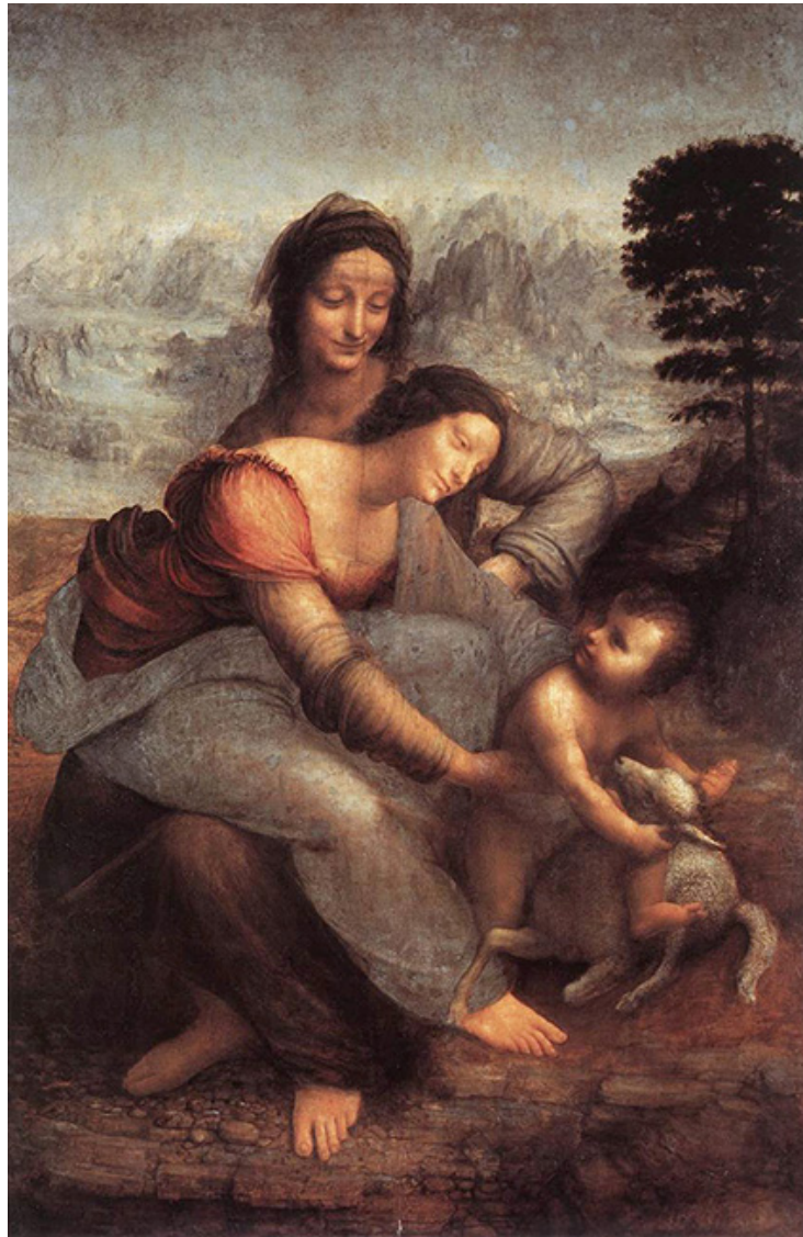
La Virgen, el niño Jesús y santa Ana, c. 1510, óleo sobre madera, 168 × 130 cm, París, Museo del Louvre.

El tema de esta obra persigue a Leonardo da Vinci desde 1500. De hecho, elabora varios bocetos diferentes que representan a la Virgen, al niño Jesús y a santa Ana. El episodio no proviene de la