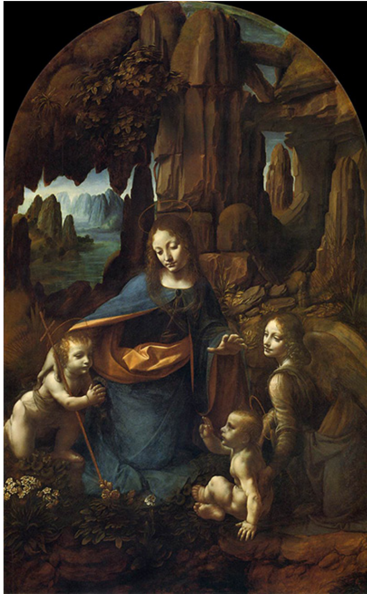
La Virgen de las rocas , 1495-1508, óleo sobre madera, 189,5 × 120 cm, Londres, National Gallery.

Existen dos versiones de este cuadro: la primera (1488) se conserva en el Louvre, en París, y la segunda, en la National Gallery de